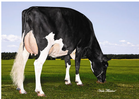
SCOTCH LAKE GRANDPRIZE MINERVA