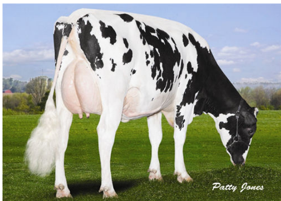
KROLANE GRANDPRIZE XEROX