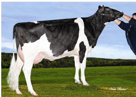
BOREVIEW GP AVA